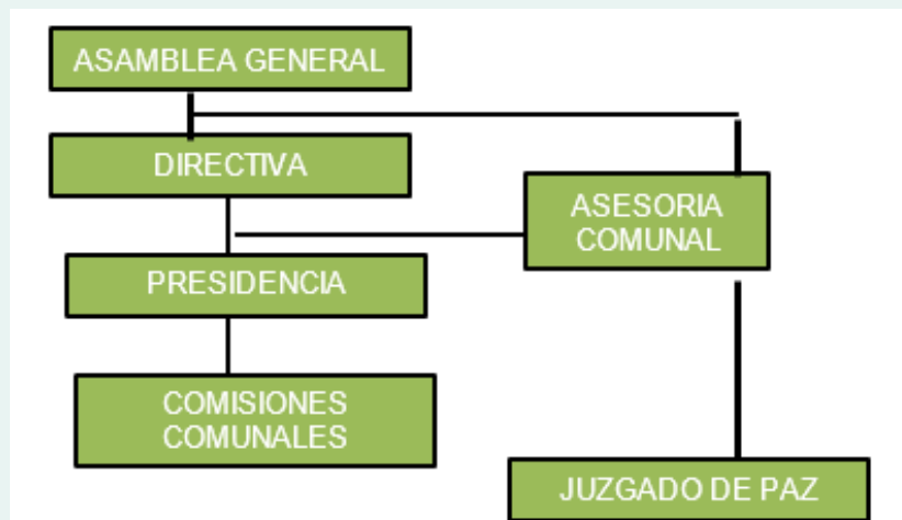
Gráfico N°1: Estructura orgánica de la Comunidad Campesina de Masma

De acuerdo con la Ley General de Comunidades Campesinas, los órganos principales de Gobierno son: la Asamblea General, la Directiva comunal, y los comités especializados por actividad. De manera que la estructura organizacional de la Comunidad Campesina de Masma, al igual que del resto de las comunidades aledañas, sigue esta conformación: